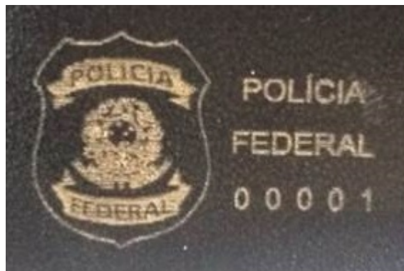
FIGURA 3 - IMAGEM MERAMENTE ILUSTRATIVA

1.4.1.8. O visor plástico, que será aplicado na aba nº 2, visão interna – figura 4, será composto de um corte retangular de PVC (Filme Plastificado Composto 100% Policloreto de Vinila), tipo cristal transparente, com espessura mínima de 0,30 mm, com gramatura de 220g/m2 a 270 g/m2, a transparência mínima é de 98,0%, incolor.